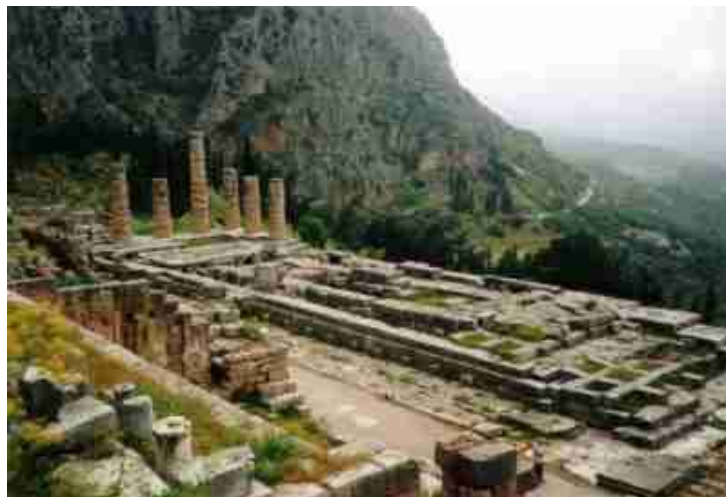
Der Apollon Tempel

Delphi war die berühmteste Orakelstätte der Antike. Die Griechen gingen davon aus, dass sich an dieser Stelle der Mittelpunkt der Welt befand.